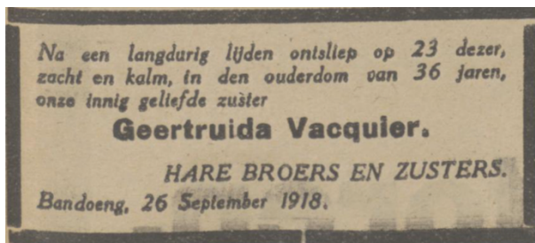
De Preangerbode van 26 sept. 1918.