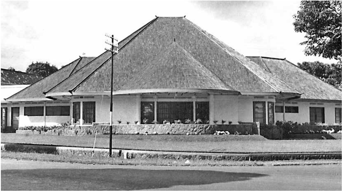
Huygensweg 4, Bandoeng (particuliere collectie).