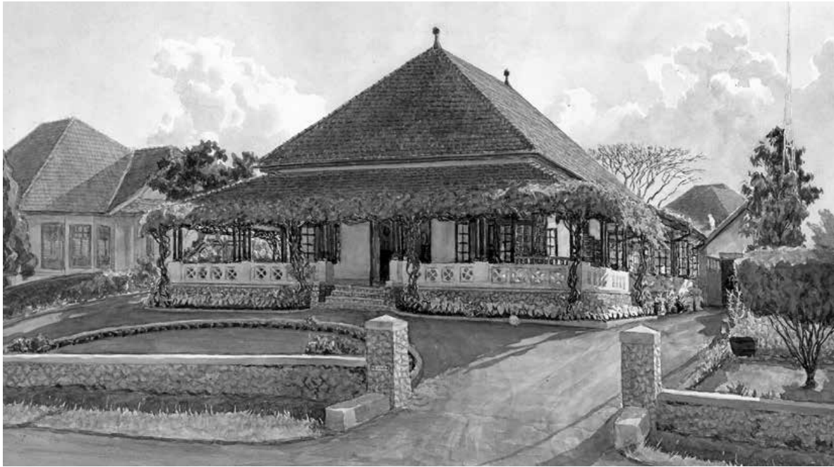
Parkweg 8, Bandoeng.