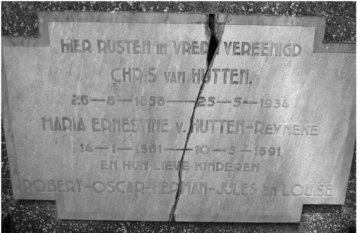
Begraafplaats Peneleh te Soerabaja, Graf nummer B1132, vak H (bron: www.krancher.com).